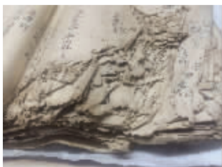
◀征集到的部分族谱，因其残破，更显示出这项工作“抢救历史”的意义

悉，项目启动以来，在不到两年的时间内，已征集到5000多册族谱，涵盖了85个姓氏。同时，在石狮彭田村、南安厚阳村、南安码头镇侨情普查试点的基础上，启动了40个重点乡镇侨情普查。如果大家想要了解自己家族的根脉宗流，或者愿意为家族的全球联动事业添砖加瓦，欢迎继续捐借出自己的族谱文献，并且在平台上线后发动家族成员向平台补充更新相关信息。