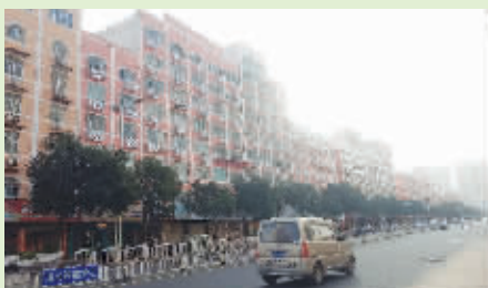
记者从城建公司获悉，自2017年7月份对八七路沿街建筑立面进行整改修复以来，目前112栋沿街建筑立面已全部完成涂料施工，并进入空调外架安装的扫尾阶段。(记者 康清辉)