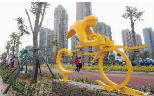
专门规划建设自行车道、布设公共自行车租赁点，这可以说是学府路改造的一个亮点配套。近日，建设方在学府路御璟天下对面的路边景观带中增添了几座骑行雕塑，让学府路改造“做加法”的特色更为彰显。(记者 康清辉 颜华杰)