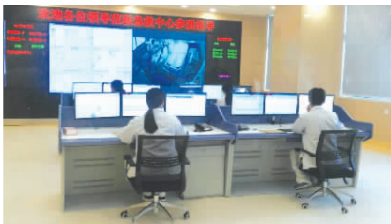
2017年12月22日，石狮新的120调度指挥中心开始试运行。该指挥中心安装了先进的120急救指挥调度系统，医院现有的8辆救护车全部安装了GPS全球定位导航系统及移动信息传输系统，有效提高急救救危的及时性。