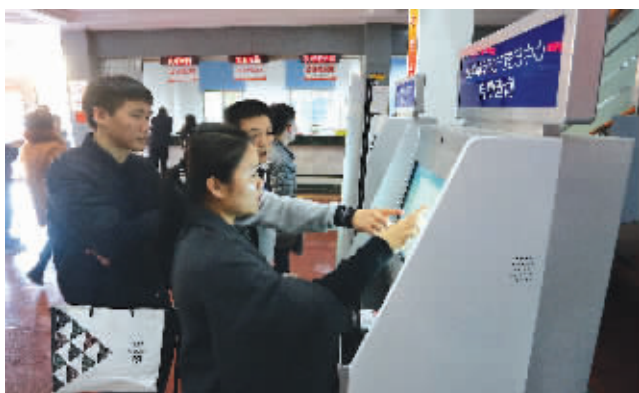
2017年12月11日，石狮市不动产登记中心正式开通不动产登记情况自助查询服务。市民凭身份证“刷卡”，再用手机号验证，只需1分钟左右，个人房产登记信息查询结果表就会通过自助终端机自动打印出来。(记者 吴汉松 颜华杰)