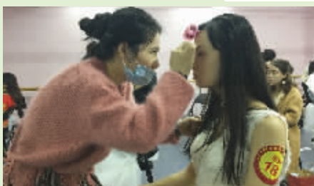
石狮市第七届产业职工技能大赛再擂战鼓，美容师岗位技能竞赛2017年12月28日开赛，来自我市多家美容机构的30余名美容师同台竞技。(记者 庄玲娥)