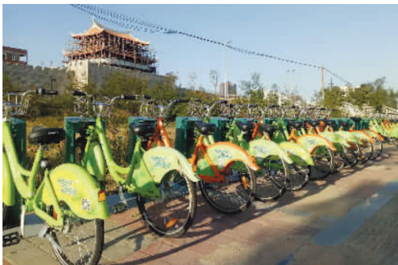
石狮公共自行车二期50个站点投入试运行。记者从石狮市城市资源经营公司获悉，二期共投放1500辆车，除了加密市区的站点布设外，二期更是将站点外延到永宁和高新区并已投放了车辆，更好地服务旅游景区、产业园区等人流密集地的出行需求。(记者 康清辉)