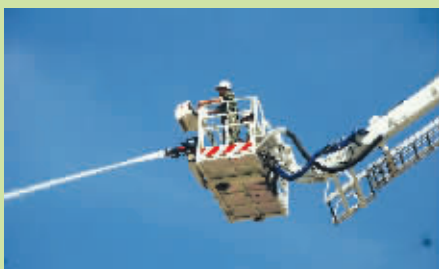
可登高32米救援灭火、360度全回转作业、智能控制……近日,这辆具有多项优点的32米登高平台消防车正式加入石狮消防队伍。