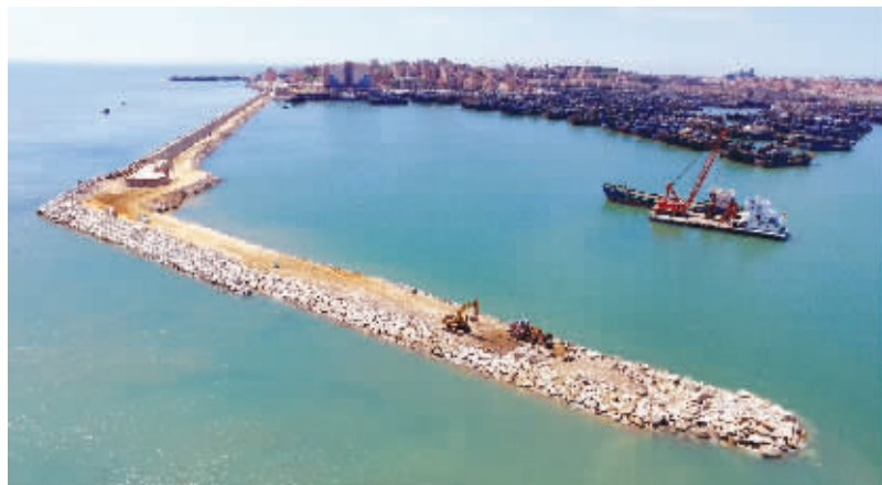
日前,记者在祥芝国家中心渔港扩建工程施工现场看到,防波堤建设已日臻完善。据该项目负责人介绍,预计在一个星期内完工。据介绍,目前已建成防波堤220米,预计再建设98米完工,总长度318米,施工队伍正在抓紧进行扭王字块安装、沉箱、挖泥等工作。