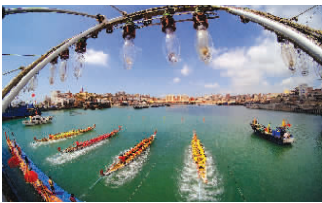
6月26日,石狮市第十届渔民文化节开幕式在祥芝举行。本届渔民文化节以“风情渔港·魅力祥芝”为主题,包含民俗表演、全民健身、文化艺术、渔民竞技等系列活动将一直持续至8月16日。