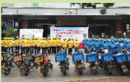
7月5日,我市在德辉广场举办“送餐再忙·安全不忘”交通安全承诺书签订仪式。活动中活动主办方呼吁,外卖小哥要安全送餐,文明出行。