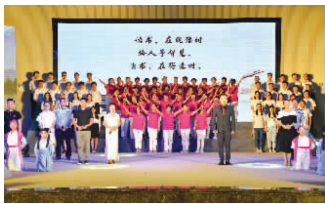
7月1日,“全民悦读·见证成长”活动启动仪式在厦门外国语学校石狮分校举行,为期150天的活动期间,我市将继续完善公益图书服务网络,深化“你选书·我买单”活动等。