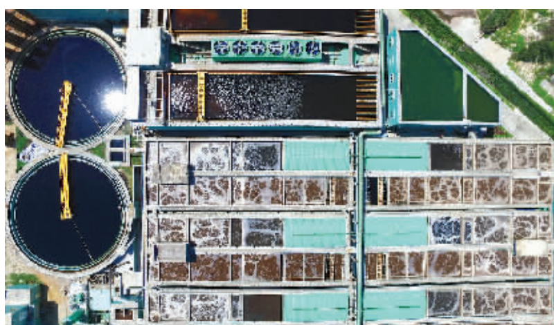
记者从石狮市锦尚环境工程有限公司了解到,由石狮市循环经济发展有限公司接管运营绿源环境工程后,抽调精兵强将有序、高效地对绿源环境工程各系统进行整改、修复及提升。目前,锦尚环境工程每天净化处理1.5万吨工业废水,服务锦尚集控区企业发展。