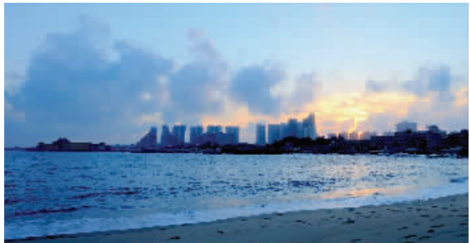
观音山海湾的黄昏(李桂芳)