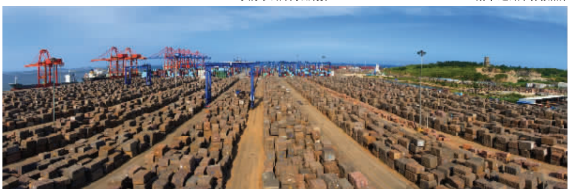
海丝起点石湖港(苏德辉)