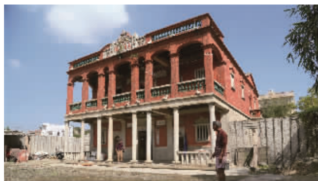
远瞩楼(蚶江古山村)