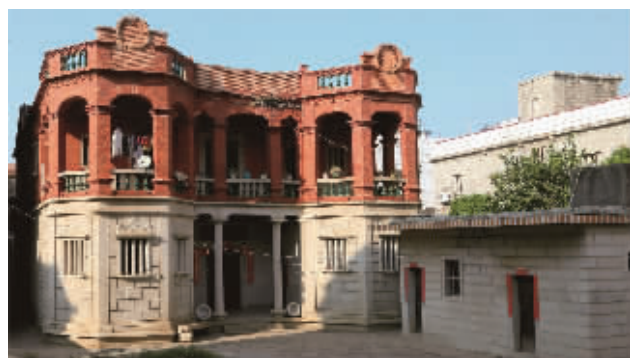
汲泉楼(祥芝古浮村)