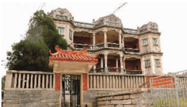
寿萱楼(宝盖仑后村)