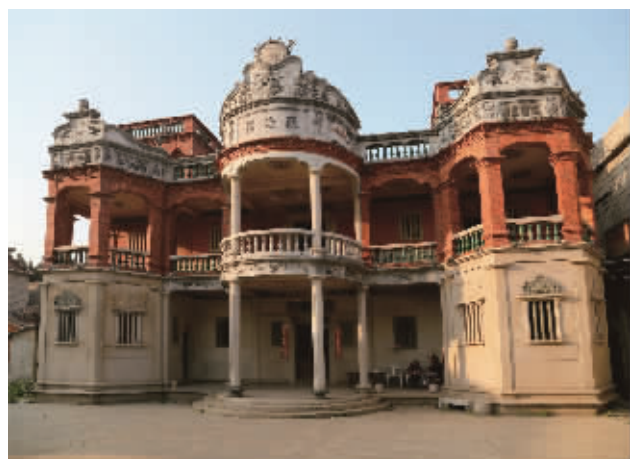
观海楼(锦尚东店村)