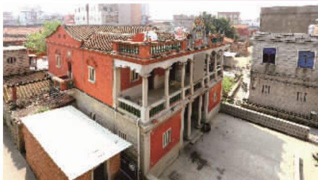
遐观楼(蚶江洪窟村)