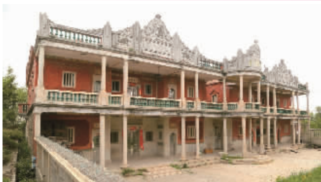
康乐别墅(永宁子英村)