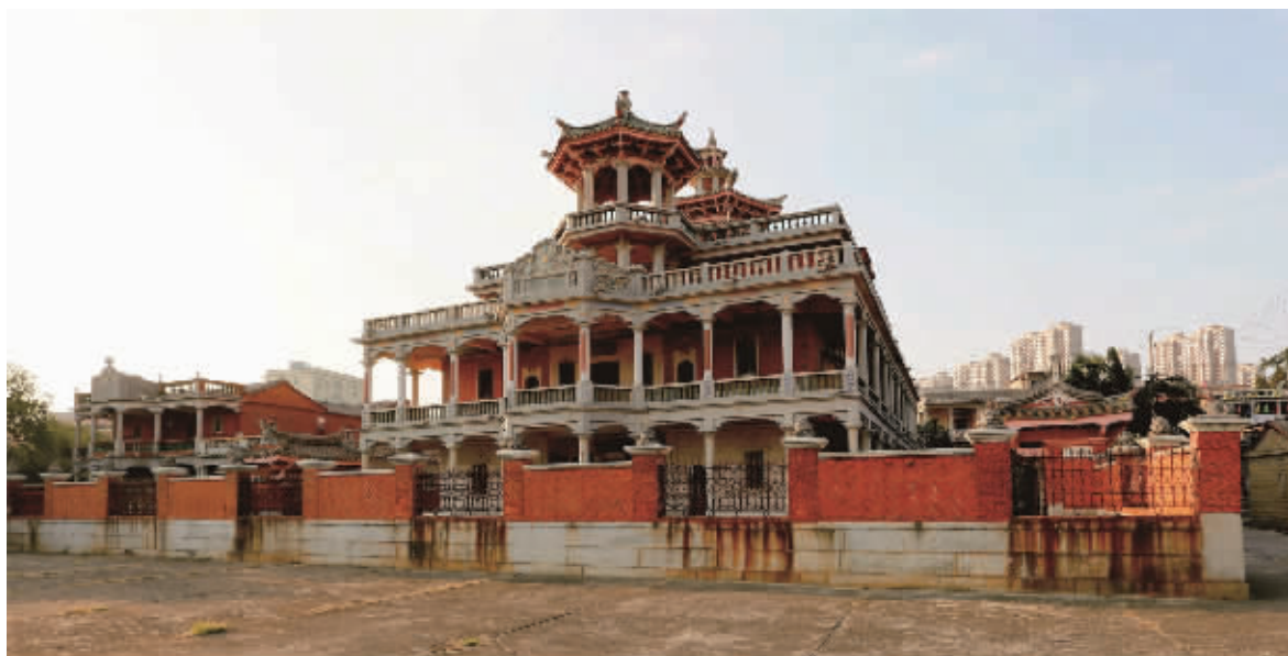
景胜别墅(宝盖龙穴社区)