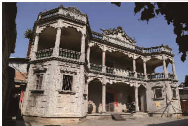
维协楼(灵秀港塘村)