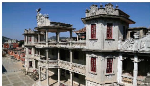
杨家大楼(永宁后杆柄村)