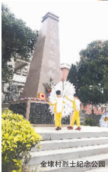
金埭村烈士纪念公园